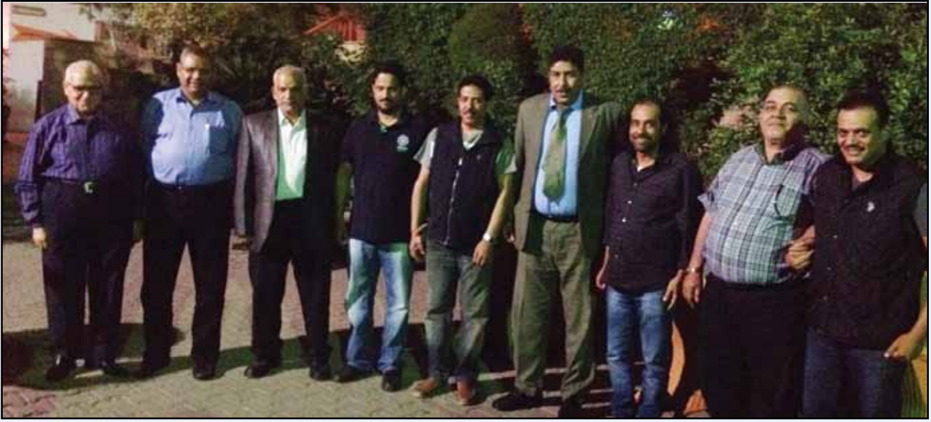
الوفد الكويتي مع ابراهيم هيكل رئيس النقابة العامة للعاملين بالاتصالات